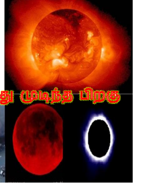
வெளி 4-19 நடந்து முடிந்த பிறகு