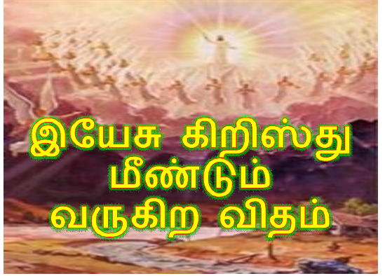
இயேசு கிறிஸ்து மீண்டும் வருகிற விதம்